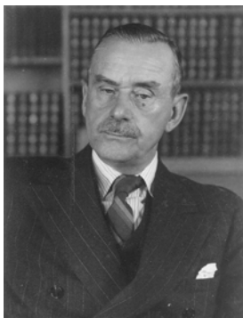
69 Thomas Mann

Mail: druckerei@axl-print.de - Internet: www.axl-print.de