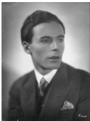
Nr. 68 Klaus Mann