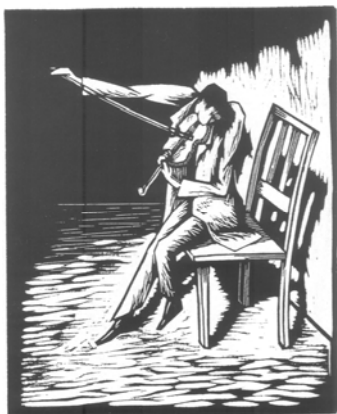
Nr. 60 Thomas Mann/Otto Nückel

Bankeinzug, VISA und Mastercard werden gerne akzeptiert.